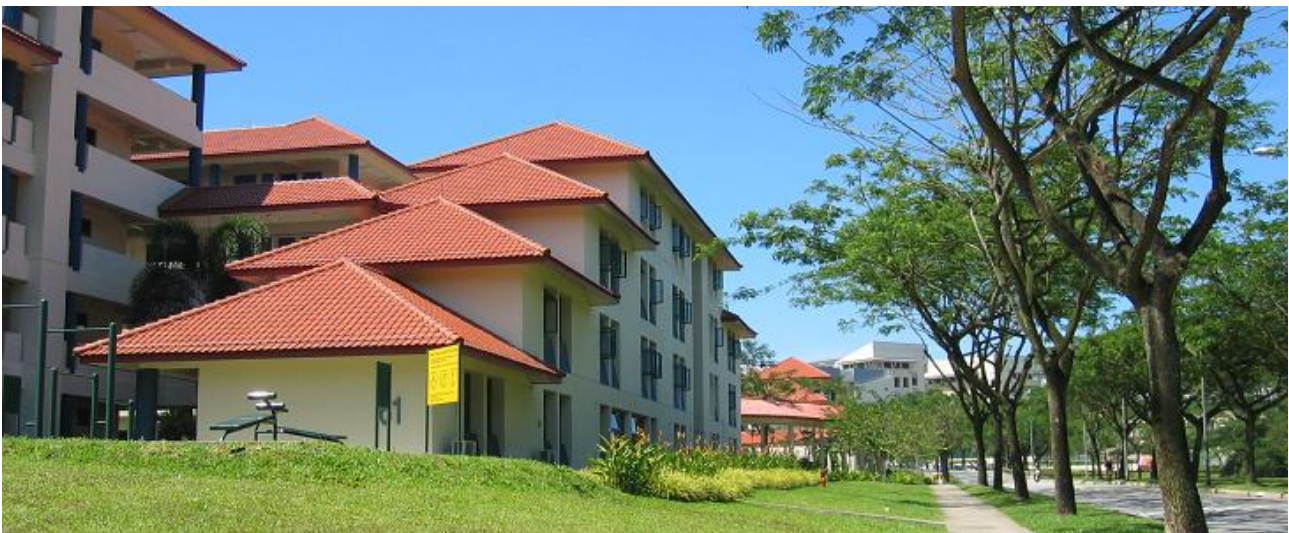
Det var i huse, som dem på venstre side, at jeg boede i under mit udvekslingssemester

I Singapore er det dyrere at spise hjemme end at spise ude og da tekøkkenet heller ikke var beregnet til at kunne lave mad i, så spiste vi i kantinerne på campus. Hver anden dorm på NTU har tilknyttet en kantine, hvor man kan spise alle dagens tre måltider i. Singapore ligger midt i Sydøstasien, så maden man kunne købe var utrolig variende. Næsten alle kantiner havde en indisk, koreansk, kinesisk og vestern bod, så vi fik spist os igennem det meste af Sydøstasien i løbet af semestret.