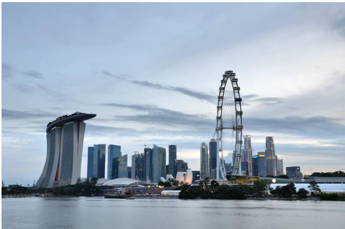
Skyline over centrum af Singapore

I de første to uger, før jeg flyttede ind på campus, hang jeg ud med en gruppe af andre udvekslingsstuderende. Vi brugte tiden på at lære Singapore bedre at kende, hvor vi bl.a. så seværdigheder såsom: Garden by the Bays, Little India, var på museer og i zoologisk have, og til flere gange var vi også oppe i højhuse for at nyde udsigten ud over Singapore.