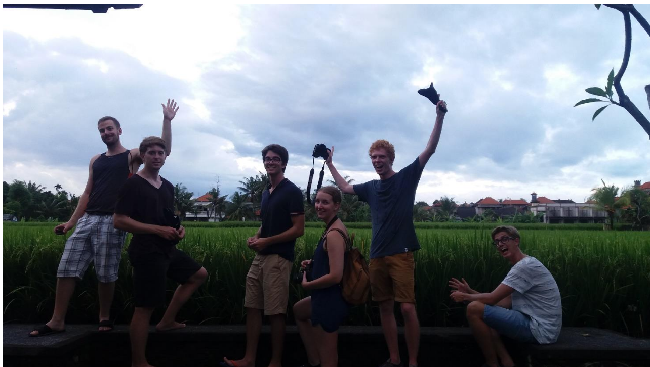
I vores efterårsferie var vi en stor gruppe som sammen rejste rundt på Bali i en uges tid

Der foregik hele tiden noget på NTU som man kunne tage til koncerter, film eller andet. Noget jeg især husker, er et event der blev afholdt over en uges tid, hvor en gruppe af studerende havde gemt en skat på NTU. Gruppen gav så over Facebook små hints om, hvor skatten var gemt. Det var virkelig morsomt og folk gik meget op i skattejagten, de lavede kort og rendte rundt på hele campus for at lede.